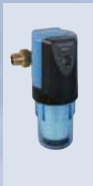
DRUFI FF 2315.00.003