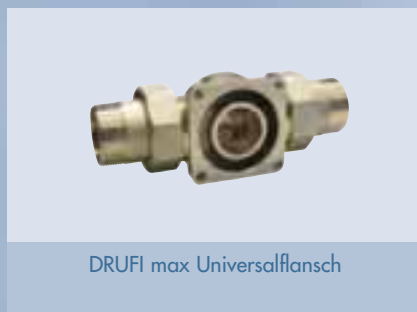
DRUFI max Universalflansch