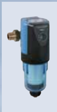
DRUFI DFF 2315.00.002