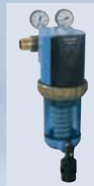
DRUFI MAX FR 2315.00.122