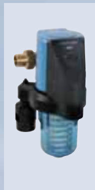
DRUFI FR 2315.00.001