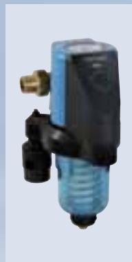
DRUFI DFR 2315.00.000