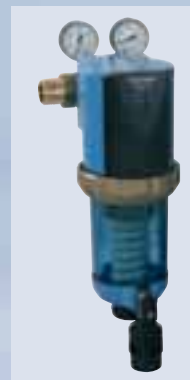
DRUFI MAX DFR 2315.00.121